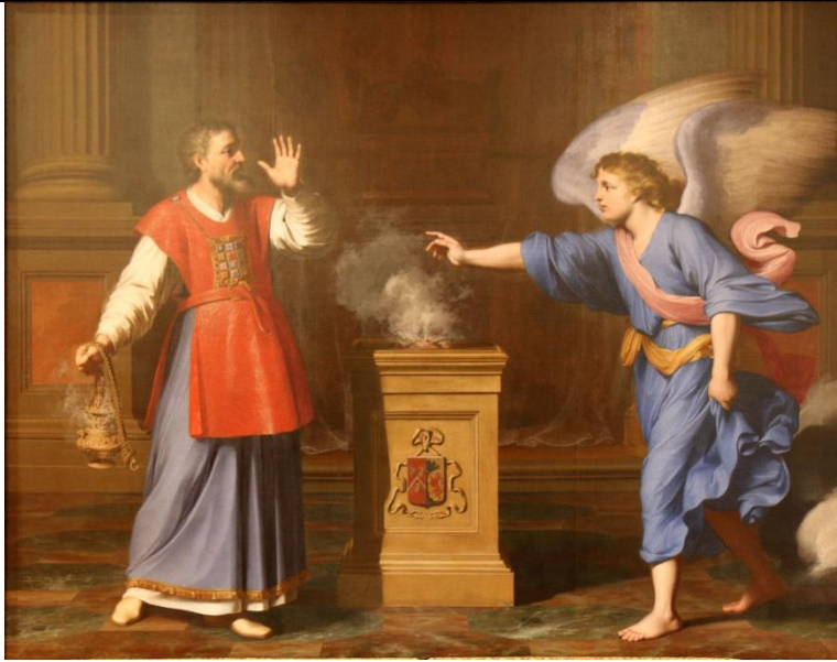
(Maler: Reynaud Levieux)

Welche Ereignisse werden auf den Bildern gezeigt?