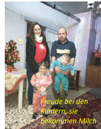
Freude bei den Kindern, sie bekommen Milch

Franziskanern in Slinfe in der Nähe von Latakia zu treffen. Das besonders Erfreuliche daran ist, dass diese HelferInnen immer mehr werden, ihre Zahl liegt mittlerweile bei 100. Diese betreuen ungefähr 2.000 Familien, dazu viele kranke und einzelne,