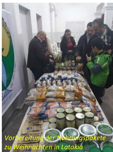
Vorbereitung der Nahrungspakete zu Weihnachten in Latakia

Ich persönlich sehe in jenen, die in der Heimat bleiben, ein gutes Potenzial für den allmählichen Wiederaufbau, falls sie Unterstützung bekommen. Wir müssen dabei bedenken, dass die meisten HilfeempfängerInnen von sich aus viel mehr an „Hilfe zur Selbsthilfe“ als an Almosen interessiert sind. Das bewahrt die Menschenwürde und passt gut zum Leitbild der Korbgemeinschaft , dass die