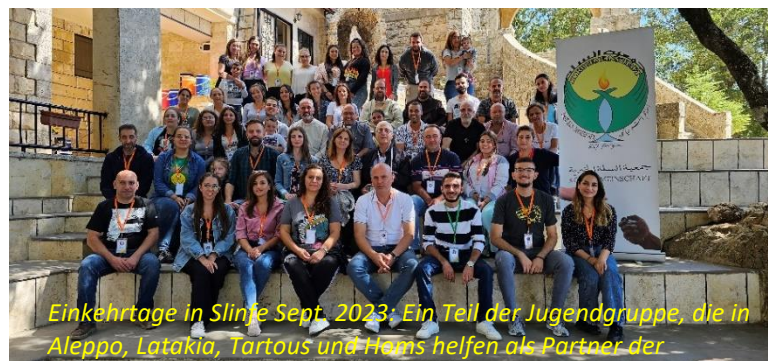
Einkehrtage in Slinje Sept. 2023: Ein Teil der Jugendgruppe, die in Aleppo, Latakia, Tartous und Hama helfen als Partner der

Diesen Jugendlichen ist es ein Anliegen, ihre notleidenden Mitmenschen aufzusuchen und ihnen zu helfen. Sie verbinden sich im Gebet, sie stehen hinter ihren Hirten, den Bischöfen und Pfarrern. Sie sind christlich gut motiviert. Die humanitären Hilfsgüter, die wir von Österreich und Deutschland versenden, werden durch sie möglichst gerecht verteilt. Sie besuchen Altenheime, Waisenhäuser und Heime für Menschen mit Behinderung. Sie erkundigen sich nach den dringlichsten Bedürfnissen der Armen und versuchen, ihre Not bestmöglich zu lindern. Sie verteilen kleine Bargeldbeträge,