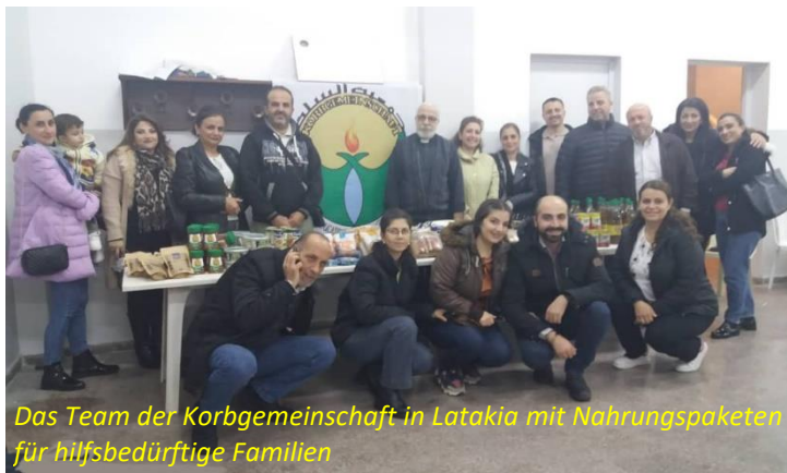
Das Team der Korbgemeinschaft in Latakia mit Nahrungspaketen für hilfsbedürftige Familien

Sie schauen auf die Kinder und bemühen sich, dass diese trotz aller Entbehrungen die Freude am Leben nicht verlieren. Sie schlagen interessante Ideen vor, die zur Stärkung beitragen können. Ich hatte das Glück, sie im Rahmen meines letzten Syrienbesuchs im September dieses Jahres bei ihren Einkehrtagen bei den