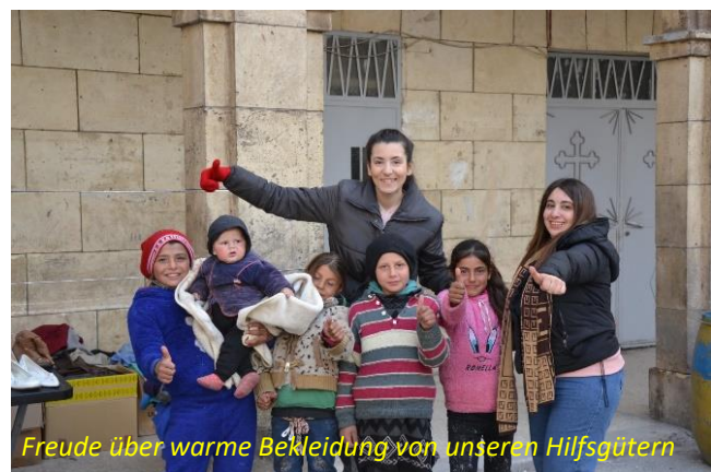
Freude über warme Bekleidung von unseren Hilfsgütern

Hilfe stets auf Augenhöhe gewährt werden soll. Die