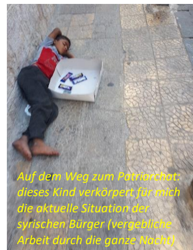
Auf dem Weg zum Patriarchat: dieses Kind verkörpert für mich die aktuelle Situation der syrischen Bürger (vergebliche Arbeit durch die ganze Nacht)

Auch die Schulbildung kostet mittlerweile viel. Die Privatschulen verlangen angesichts der steigenden Teuerungsraten unerwartet immer höhere Gebühren. Den Eltern bleibt dann keine